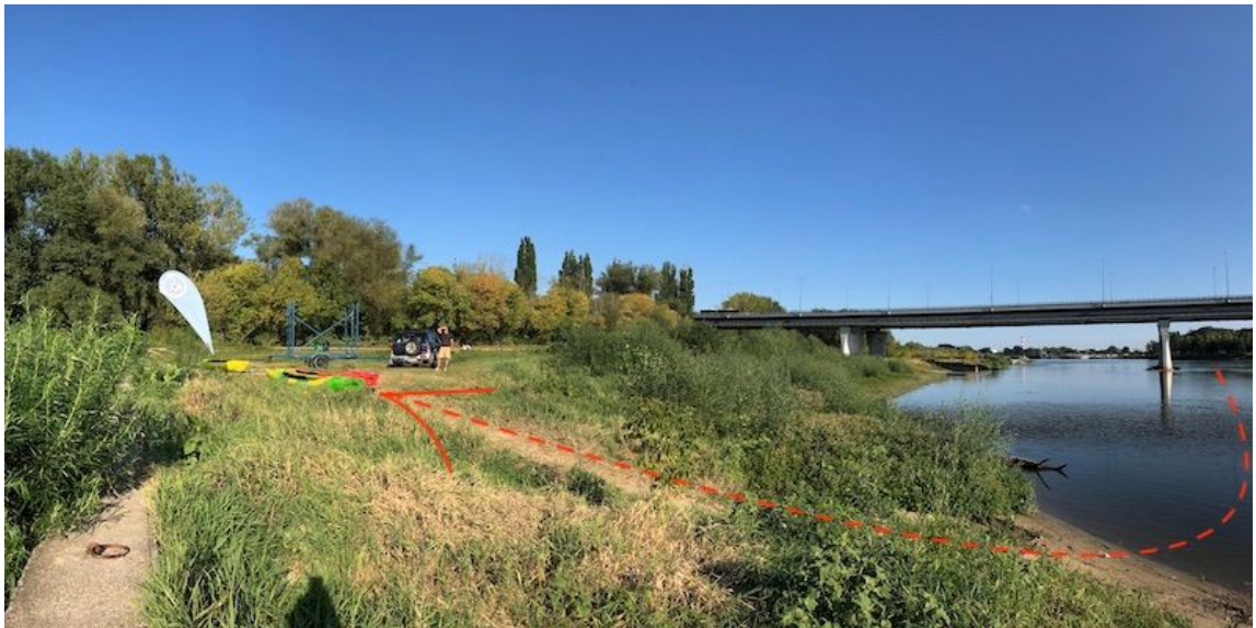
Saska Kępa - miejsce zakończenia sływu

Lokalizacja. Celem Twojego sływu jest miejsce w pobliżu naszej siedziby, mieszczącej się tuż za mostem Łazienkowskim, przed plażą Saska Kępa. Punkt zdania sprzętu znajduje się na prawym brzegu Wisły, ok. 150 metrów za mostem Łazienkowskim (drugim mostem który będziesz przepływać na swojej drodze).