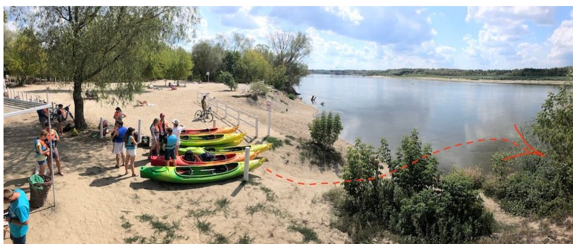
Plaża Romantyczna - miejsce początku spływu

Miejsce. Miejsce spotkania to Plaża Romantyczna w Warszawie . Mapa oraz sposób w jaki dotrzeć można na miejsce jest dokładnie wyjaśniony na naszej stronie internetowej w opisie trasy którą płyniesz.